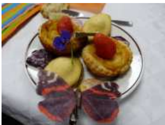
Madeleines Pasteis de Nata et Pétales de roses et Feuilles de menthe au sucre.