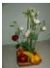
FLEURS ET FRUITS