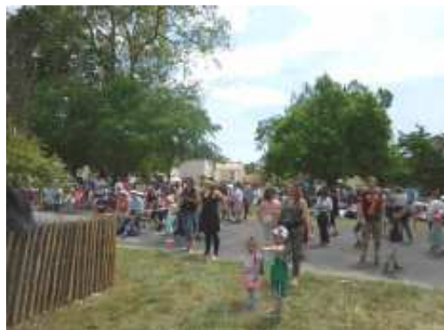
Vide grenier du 21 Mai au château Malartic

La feuille du quartier Barthez-Malartic - Editée par l'association MVM - Mieux Vivre à Malartic numéro 70 - trimestriel mai 2016