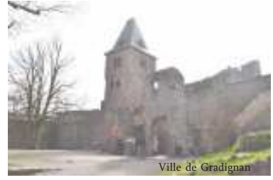
Ville de Gradignan

A l'auberge du château de Frankenstein où nous déjeunons, tout le monde apprécie le cadre et les spécialités du restaurant surtout le apfelstrudel. Délicieux ! Puis petite promenade digestive au château de Frankenstein. Les propriétaires au moyen-âge n'avaient rien de diabolique. Le nom a été récupéré pour raconter une légende.