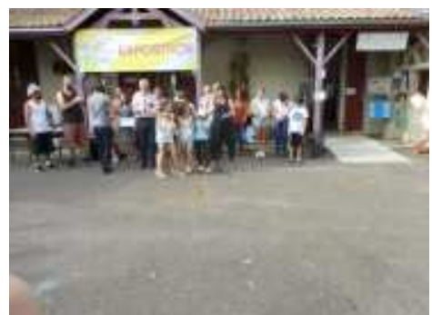
Remise des prix de l'art est dans le pré