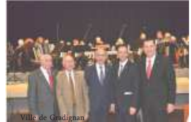
Ville de Gradignan

Dans la salle du «Sport-und Kulturehalle», la salle des sports et de la culture, toute la ville est représentée, plus de deux cents personnes, la municipalité nous offre d'abord un concert de