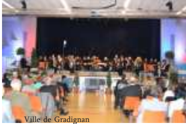
Ville de Gradignan

Dans la salle du «Sport-und Kulturehalle», la salle des sports et de la culture, toute la ville est représentée, plus de deux cents personnes, la municipalité nous offre d'abord un concert de