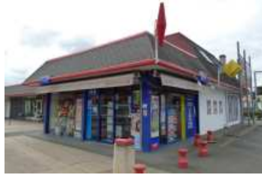
Le centre commercial de Malartic