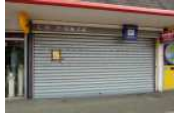
L'agence postale de Malartic

Nos lecteurs se souviendront que notre association avait lancé une pétition en 2014 pour exiger de La Poste le maintien du bureau de Malartic. Grâce à l'intervention de la Mairie nous avons obtenu qu'il soit au moins ouvert une demi journée 5 jours sur 7. Hélas début 2016 la décision d'une fermeture définitive est tombée en raison d'une trop faible utilisation de la part des habitants. Celle-ci devenant effective le 1 er avril.