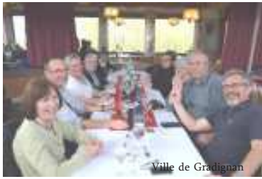
Ville de Gradignan

A l'auberge du château de Frankenstein où nous déjeunons, tout le monde apprécie le cadre et les spécialités du restaurant surtout le apfelstrudel. Délicieux ! Puis petite promenade digestive au château de Frankenstein. Les propriétaires au moyen-âge n'avaient rien de diabolique. Le nom a été récupéré pour raconter une légende.