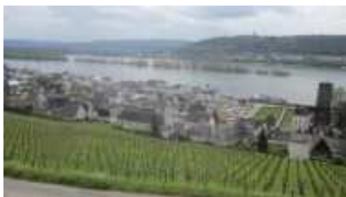
Les vignes sur le Rhin à Rudensheim