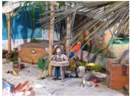
Thème : Robison Crusoe