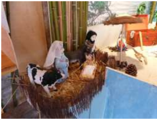
Crèche de Sempesserre