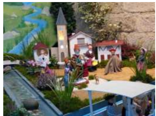
Thème : Sans famille