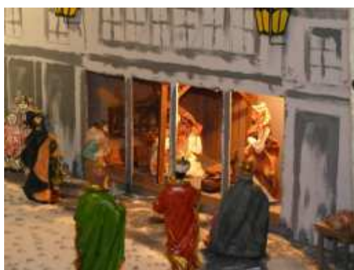
Crèche de Flamarens