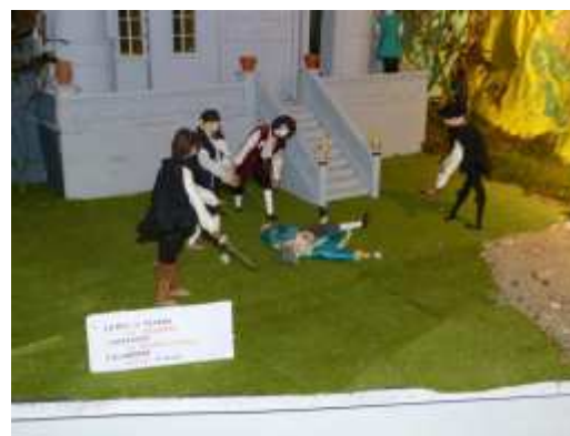
Thème : le Bossu