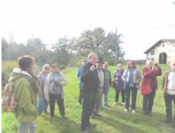
Le groupe des moulins au castrum