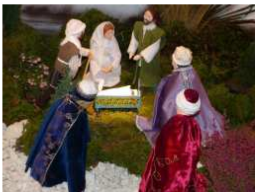
Crèche de saint Antoine