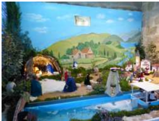
Crèche de Castets Arrouy