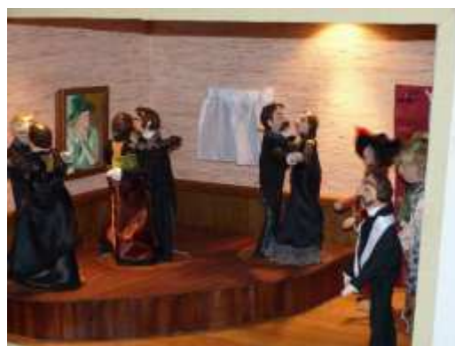
Thème : Arsène Lupin