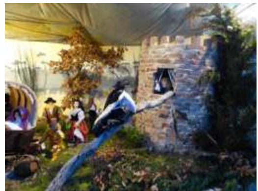
Thème : Capitaine Fracasse