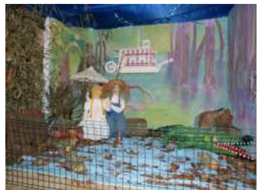
Thème : Tom Sawyer