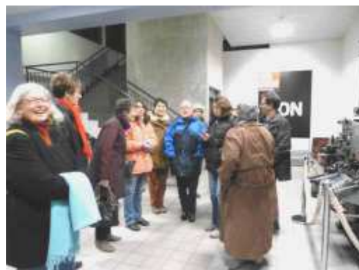
Visite de MVM à Sud-Ouest