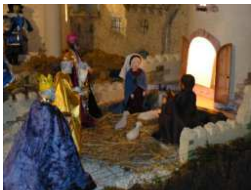
Crèche de Miradoux