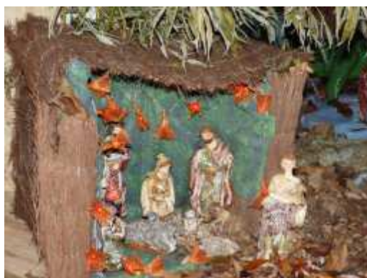
Crèche de Peyrecave