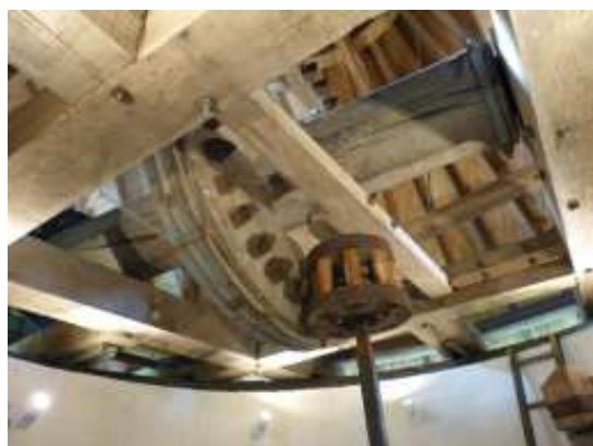
Le mécanisme de meulage