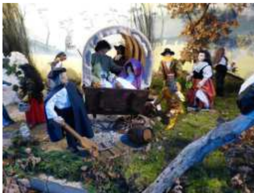
Crèche de Plieux