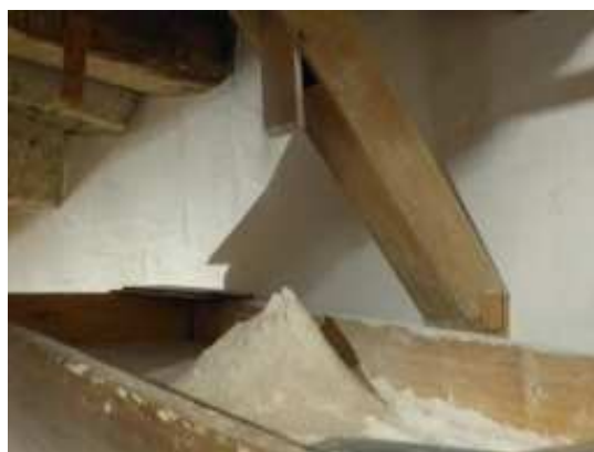
Le résultat du travail du moulin : la farine