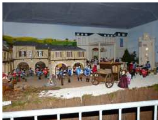
Thème : les trois mousquetaires