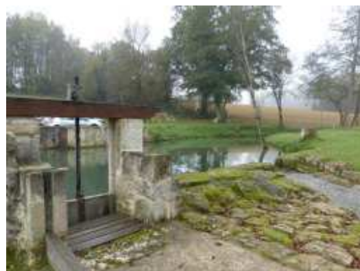
Moulin de Pinquet à St Félix de Foncaude