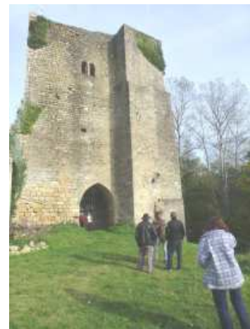
La porte de Sauveterre du castrum de Pommiers