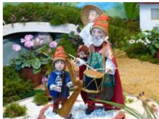
Crèche de Castets Arrouy : sans famille