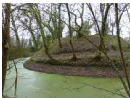
La Motte Saint Albe