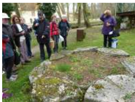
Débat sur la meule du moulin de Cayac

Le printemps est arrivé et avec lui l'espoir de belles journées ensoleillées.