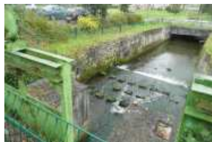
Le bief du moulin de Cazeaux

Moulin à farine jusqu'à la fin du 19ème siècle, le site accueille de 1903 à 1955 une importante tannerie, On dénombre jusqu'à 150 ouvriers en 1940, La tannerie fabrique des chaussures, des courroies pour machines agricoles, des harnais pour chevaux, De 1957 à 1975 l'usine des Tricots St Joseph prend le relais, Mondialement connus les tricots St Joseph produisent des vêtements de luxe en jersey, Au plus fort de la production en 1970, plus de mille ouvriers travaillent dans l'usine, L'arrivée du jersey produit à Taiwan, signera la fermeture des tricots St Joseph, En 1987 la commune fait l'acquisition des locaux afin de créer un espace de loisirs, De nos jours de nombreuses associations sportives et culturelles utilisent les locaux, On y trouve aussi un verger de kiwis dont la production est distribuée dans les restaurants municipaux (écoles, foyer-restaurant pour personnes âgées, mairie,,),