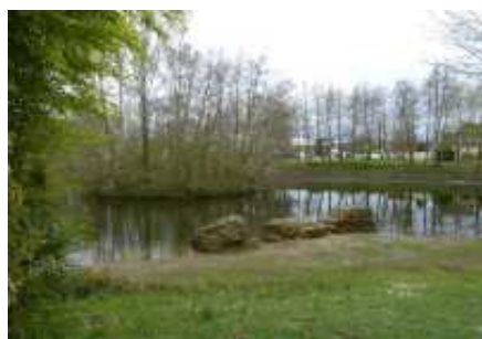
Sur les chemins des moulins