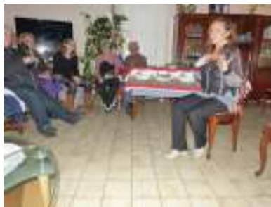
Conteuse dans ses oeuvres