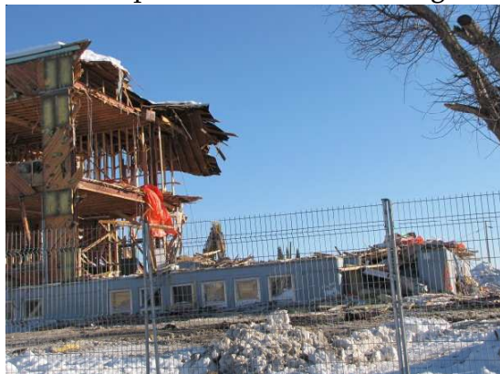
La démolition d'une école de Malartic