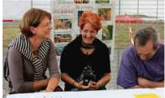
ne peuvent se faire qu'avec l'aide des bénévoles du quartier