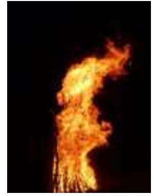
Une dernière vision de rêve avant d'allumer le feu de la Saint Jean.