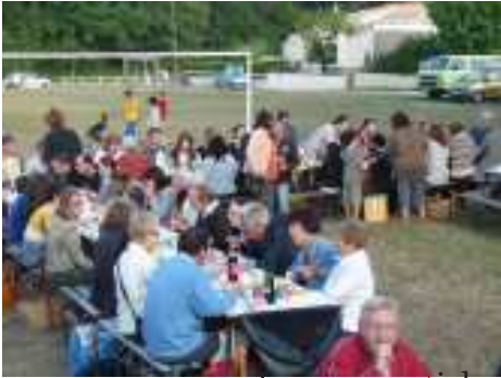
Le repas sorti des paniers s'annonce convivial et festif