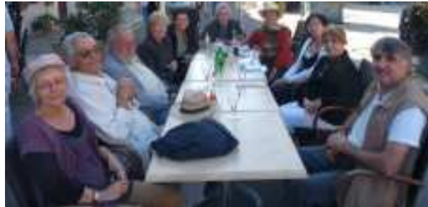
L'équipe au complet à « L'escadron volant »