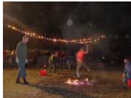
Les enfants attendent avec impatience l'autorisation de sauter le feu. Ce fut une bonne soirée!