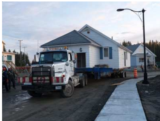
Le déménagement d'une des 200 maisons

dénonce certaines tactiques pour obtenir l'assentiment de la population : distribution de dindes de Noël, paiement de fournitures scolaires, soupers gratuits pour les participants à un sondage... : « On se croirait en Afrique, où les gens se font acheter ». Le manque de garanties sur la restauration finale du site inquiète aussi.