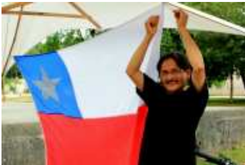
Ollé bras pour le Chili