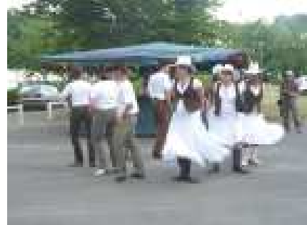
Démonstration de danse country par le PLG