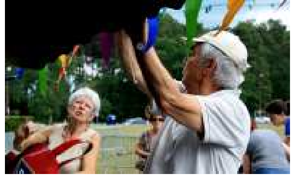
La préparation et la mise en place des stands et ateliers