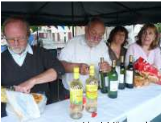
L'apéritif ouvre la soirée et favorise les rencontres