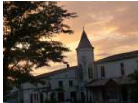
La chenille démarre, tandis que le soleil se couche lentement sur Malartic.