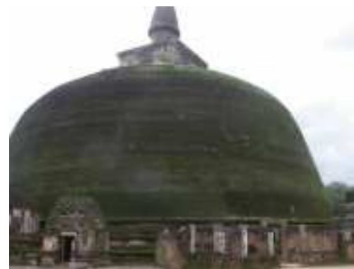
Temple troglodytique de Dambulla :

Le revenu par an et par habitant est de 840 euros, cependant il n'y a pas de mendiant. Les femmes vont travailler à l'usine (LEE Cooper) et s'occupent de la récolte du riz (les rizières représentent 30% du territoire (avec trois récoltes par an), tandis que les hommes travaillent à la forêt et à la pêche.