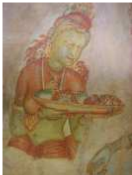
Demoielle de Sygiriya (peintures murales Vsiècle)

Après le tsunami de 2004 , le pays a été reconstruit grâce à l'aide internationale, loin des côtes, mais peu à peu, les hommes construisent des maisons de fortune près de la mer, près de leur travail de pêcheurs.