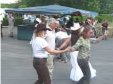
Avec la participation du public